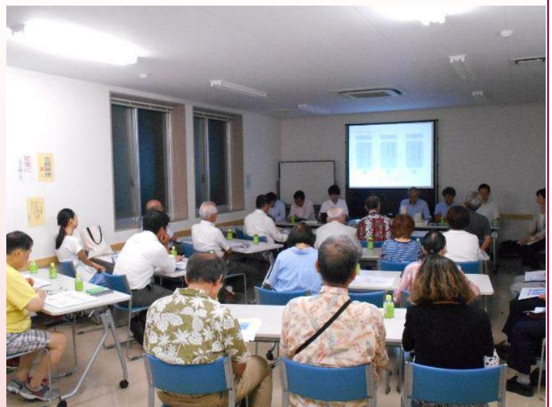
14日の様子(施設計画検討会)

商業勉強会では主に床の持ち方や共益費(管理費)の考え方について、施設計画検討会では主に都市計画の内容や一般的なマンションの設備、建物管理の基本的な考え方についての説明があり、皆様に質問や意見を出し合ってください、活気のある会となりました。