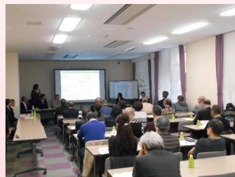
全体説明会の様子

回答) 住宅の屋上については住宅の管理組合の規程で利用方法を定めます。規程で許可がされれば利用することができます。