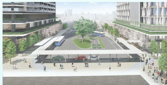
交通広場のイメージ