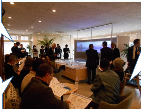
見学会の様子(オープンラウンジ)

タワーマンションに住んでいる人から、実際のマンションでの生活について話を聞いてみたいです。