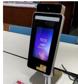
※機械の前に立つだけで自動計測できるので検温器の受渡し等による感染リスクを避けられます。

事務局員の日常的な検温や来所者の検温を行い、感染症拡大防止に努め、安心して事務局へ来訪していただける環境を整えております。