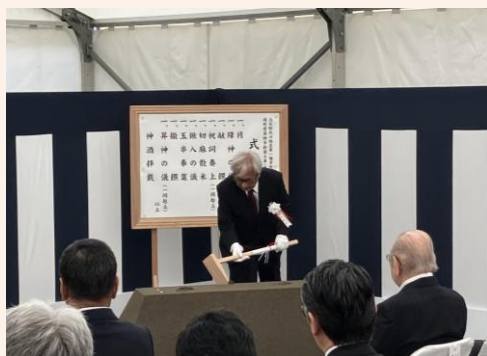
【斎鍬】 立石駅北口地区市街地再開発組合