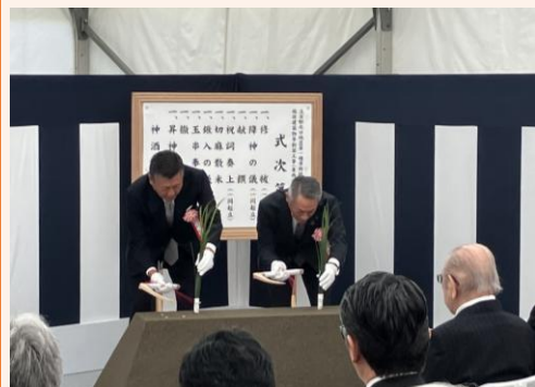
【斎鎌】 株式会社日本設計 三井住友建設株式会社