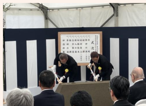
【斎鋤】 鹿島建設株式会社 三井住友建設株式会社